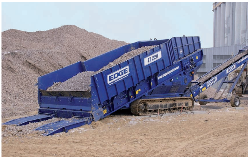
Mobilní násypka EDGE TL 220

V nabídce jsou také válcové drtiče EDGE SHREDDERY pro zpracování nejrůznějšího odpadu od pneumatik, přes stavební dřevo, komposty, až po domovní odpad včetně například lednice. Samozřejmostí je několik provedení v závislosti na zpracovávaném materiálu, automatický provoz a mimořádně nízké provozní náklady. Bubnové třídiče jsou již jenom logickým završením nabídky. Nesmírně důležitá přitom je skutečnost, že kromě naprosté individualizace všech produktů je možno si vybrat z několika typů pohonu a to diesel/hydraulika, aletro/hydraulika anebo kombinace obou tzv. duální pohon. Máte zdroj elektrické energie – napojíte se. Nemáte zdroj – otočíte klíčkem a nastartujete diesel. Prostě, elegantní a hlavně moderní řešení, které myslí na všechny eventuality.