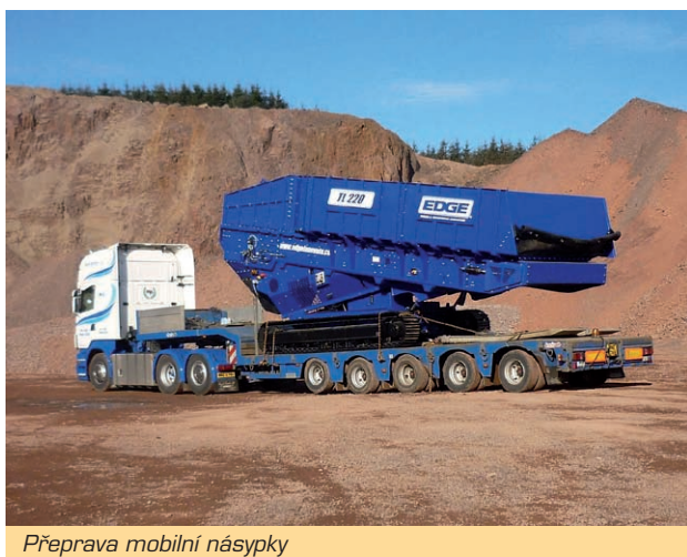
Přeprava mobilní násypky