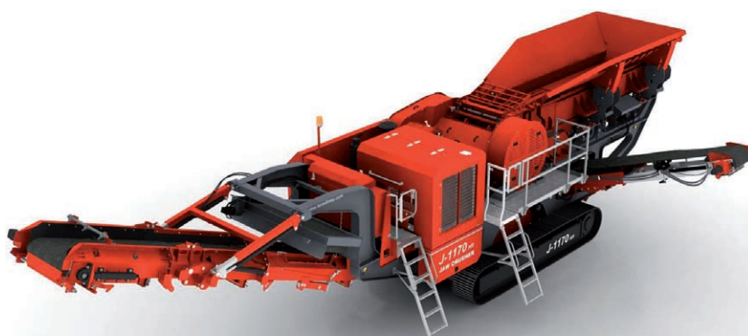
Nový čelistový drtič FINLAY J-1170