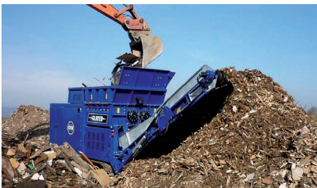
Drtič EDGE SHREDDER při zpracování dřeva