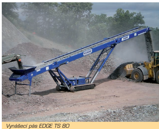
Vynášecí pás EDGE TS 80