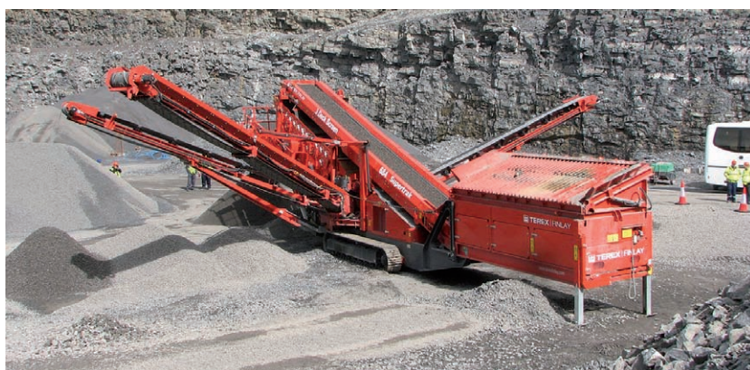
Třísitný třídič FINLAY 684

Veškeré vaše případné dotazy ohledně našich a nejen nových strojů jsme připraveni zodpovědět osobně, telefonicky, nebo elektronickou poštou. Pokud tedy uvažujete o novém stroji, nebo řešíte nějaký technický či technologický problém, neváhejte nás kontaktovat. □