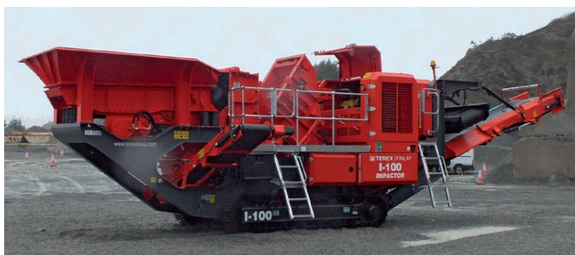
Odrazový drtič FINLAY I-100